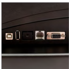
Viele Schnittstellen für Peripheriegeräte