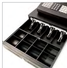
Große und robuste Stahlschublade