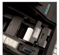
Schneller und leiser Thermodrucker